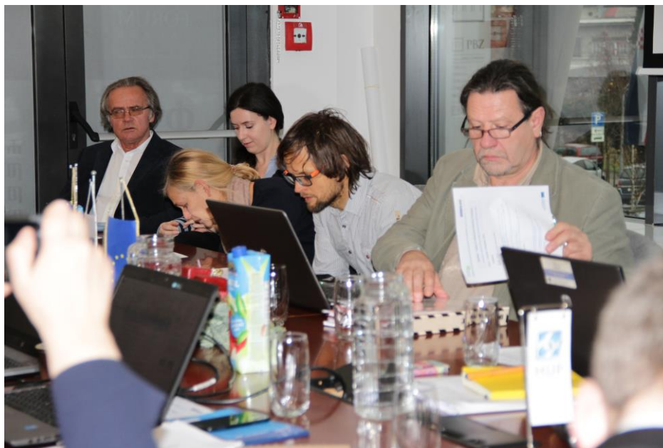
CPI Slovēnijas pārstāvis prezentēja 3. Darba pakas (Mācību programmas izstrāde) aktivitātes.

Prezentācijas raisīja detalizētu diskusiju par izvēlēto trūkstošo prasmju jomām. Pārstāvji vienojās, ka prezentētās trūkstošās prasmes ir diezgan plašas, tādēļ ir nepieciešams precizēt šīs jomas, izvēloties vienu prasmi, kas būtu vispiemērotākā visiem dalībniekiem. Partneri vienojās par izvēlētajām prasmēm un noteica pamatu turpmākai mācību programmu izstrādei.